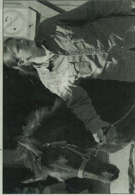
Für den Nachwuchs gab es bei der Zuchtschau den ersten großen Auftritt vor Pferdekennern.