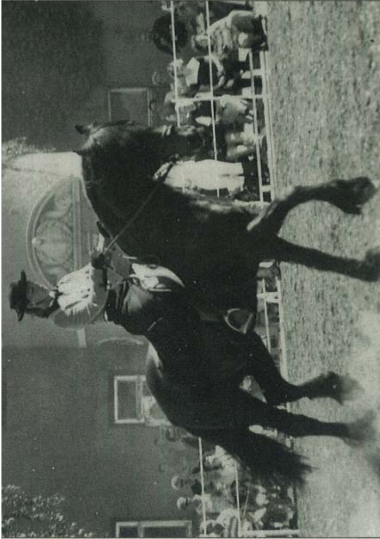
Bei der Vorführung der prächtigen Friesenpferde beeindruckten Reiter bzw. Reiterinnen das Publikum zum Teil in historischen Kostümen.