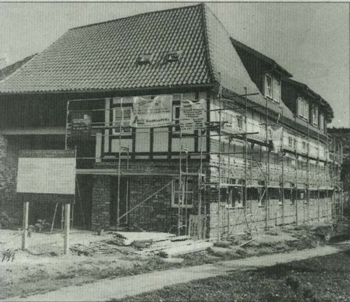
Das sanierte Drebsdorfer Gut, eingebettet in eine tolle Landschaft, hat nun jede Menge für Tourismus und Freizeit zu bieten.

Entdecken auch Sie neue Möglichkeiten für Tourismus und Freizeit. Besuchen Sie uns zum Tag der offenen Tür am 9. Mai.